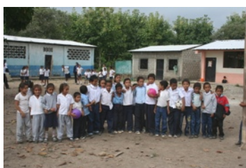
Schulklasse von Puebloviejo, ca. 2 km von den Life Forestry Plantagen entfernt

Während seiner Reise durch die deutsche Bildungslandschaft konnte sich Dr. Guillaume Long persönlich über die Idee und Umsetzung des dualen Ausbildungssystems in Deutschland informieren: Zu den wichtigsten Zielen seiner Reise zählten die Bildungsakademie der Handwerkskammer und die Siemens Technik Akademie in Berlin.